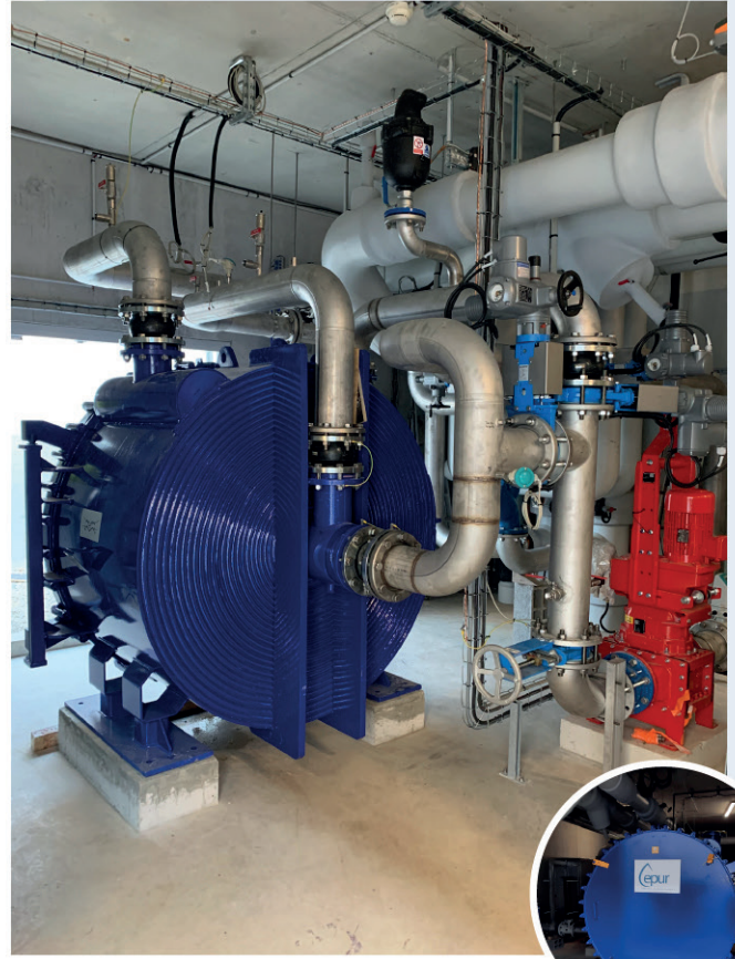
Installation à la Clinique Beausoleil à Mont...

Brevetée par Veolia, Energido est une solution qui consiste à détourner une partie des eaux usées vers un échangeur thermique, afin de transférer l'énergie qu'elles contiennent.